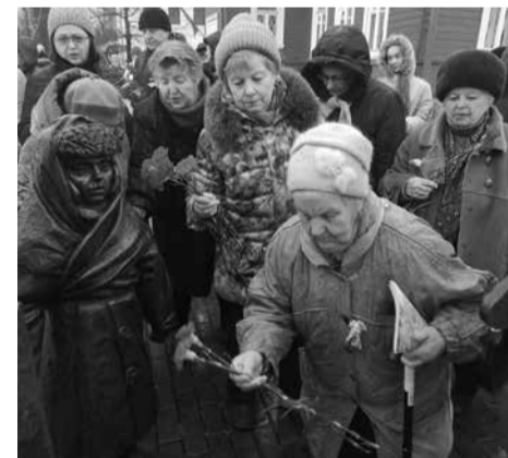
Текст: Владимир Крылов

Рады сообщить, что для жителей МО Остров Декабристов возобновляются тренировки по скандинавской ходьбе. Занятия проводятся по понедельникам и пятницам, с 10:00 до 11:30.