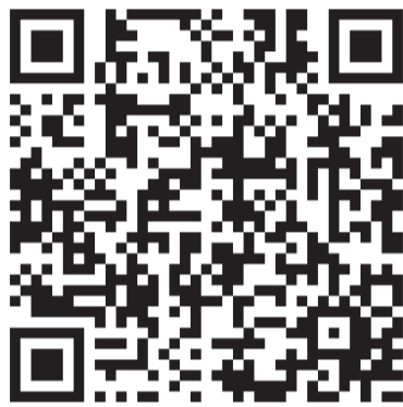
Приложения к решению №30